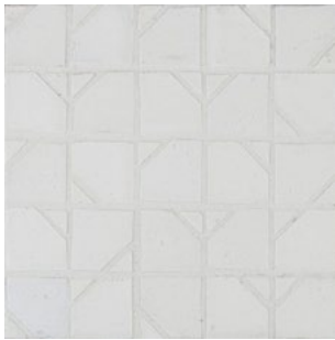
DLT 180 - Talco