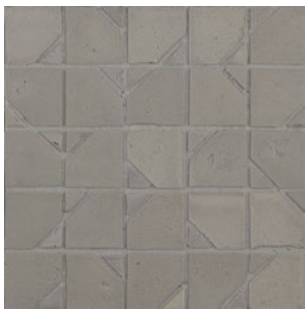
DLT 190 - Cenere