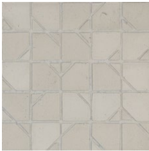
DLT 185 - Riso