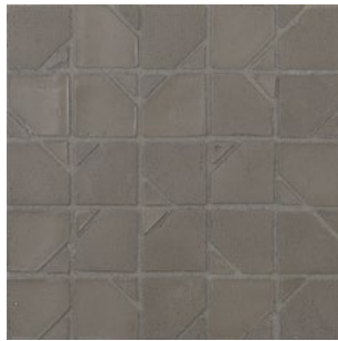
DLT 194 - Fango