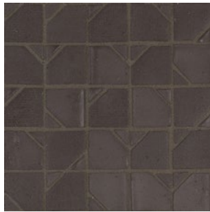
DLT 198 - Ebano