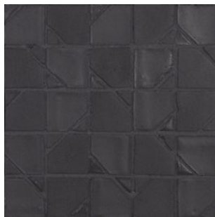
DLT 200 - Grafite